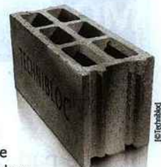
Technitherm est le premier bloc issu d'un GIE français.

Lancé en 2006, le Technibloc est le premier bloc rectifié de France. Conçu par Plattard, il est à système modulaire unique et monté à joints minces. Mais Plattard n'est pas resté les bras croisés quant au développement de son produit. Ainsi, le Technibloc a eu un petit frère, le Technitherm. Mêmes hauteurs de rectification, mêmes largeurs, même mortier-colle spécifique et même rouleau applicateur, le Technitherm a été conçu pour pouvoir se marier parfaitement à son grand frère. La pierre ponce, ajoutée à la formulation de départ, permet cependant d'atteindre une résistance thermique R de 1,35 m 2 .K/W pour le bloc et un R de plus de 1,52 m 2 .K/W pour la paroi. Outre Plattard Industries (69), le GIE Technibloc est constitué d'Albon Préfa (26), Fimaco Derrey (88), GGI (73), Sagra (42), Sepa Leonhart (67) et Tartarin (86). Ces sept-là étant aussi membres de Technitherm qui regroupe, aussi Gris Clair (25), Maggioni (21), Perin & Cie (35) et Pitois Matériaux (72) qui, eux ne sont pas membres du GIE Technibloc. [Service Lecteurs 7]