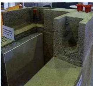
Le Poncebloc offre de multiples possibilités architecturales.

Comme son nom l'indique, Poncebloc est un bloc constitué essentiellement de pierre ponce, issue des roches volcaniques. Originaire de Turquie, cette pierre est deux fois moins dense que celle présente en France. Du coup, le concept permet d'obtenir des blocs de 1,04 à 1,20 m 2 .K/W selon les montages. Le bloc est fabriqué localement à froid par simple moulage et pression (sans cuisson), donc 100 % minéral, et 100 % recyclable. C'est un produit inerte, sans dégagement de COV. Le GIE compte sept membres : la maison-mère