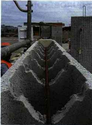
L'Innobloc, le bébé de FranceBlocs.

La particularité du GIE FranceBlocs est d'avoir été inspiré, non pas par un industriel du bloc, mais par le cimentier Lafarge. Et de regrouper autour de ses produits des majors du bloc béton. Le résultat en est l'Innobloc, un système constructif isolant, à base de pierre ponce. Il s'agit d'un bloc de coffrage qui permet de couler un voile de 3 m x 3 m répondant aux exigences de l'Eurocode 8. Une planelle est actuellement en développement et viendra compléter la gamme dans un futur proche. Le GIE comptait à l'origine trois membres indépendants : Alkern (national), Fabemi (26) et Pradier Blocs (84), le tout sous le patronage de Lafarge. Il vient d'être rejoint par l'industriel Seac (31). [Service Lecteurs 5]